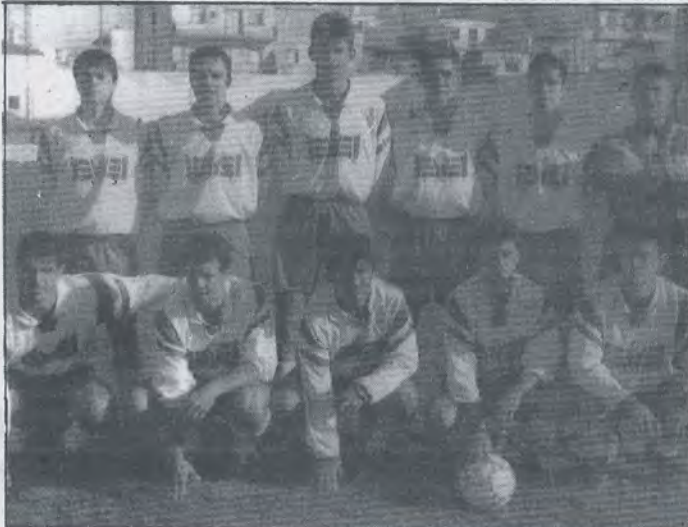
Ultima formación del Alcalá por este año que lo despidió en la cuarta posición de la tabla.

junto de Los Rosales no hizo nada en ataque, pero su labor fue acertada en defensa y mediocampo, sin olvidar al meta Tote.