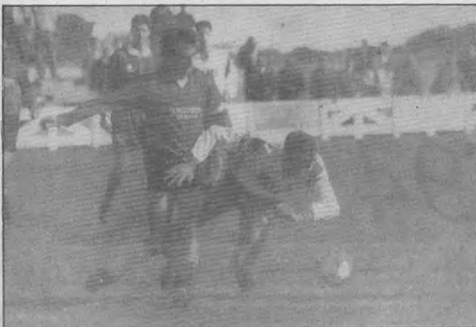
La baja de Abades fue suplida al principio por Marcos, que luego se enmendó y marcó otro gol.

Ahora habrá descanso en Preferente durante tres semanas y no habrá liga hasta el 9 de enero del 94 y en ese día el Alcalá juega fuera